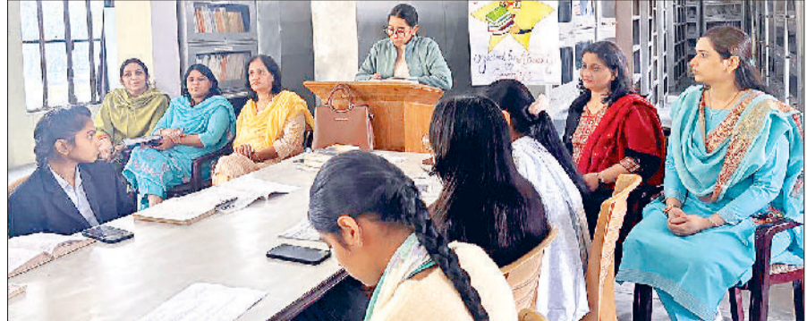
खरखोदा। स्टार रीडर चैलेंज प्रतियोगिता में भाग लेती छात्राएं।