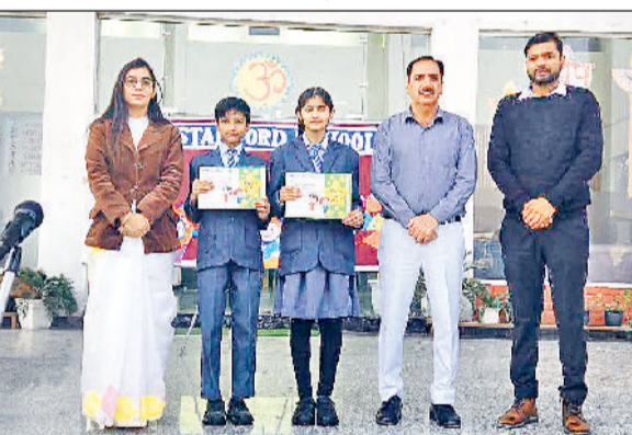
खरखोदा। विद्यार्थियों को सम्मानित करते शिक्षक।