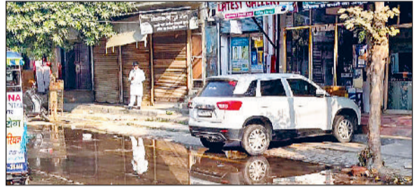
गन्नीौर। पाइप लाइन टूटने के कारण सड़क पर जमा पानी।

नगरपालिका रोड पर भारत गैस एजेंसी के पास जनस्वास्थ्य विभाग की पेयजल सप्लाई पाइप लाइन पिछले करीब एक सप्ताह से टूटी हुई है। टूटी पाइप लाइन से सप्लाई के समय पानी तेजी से सड़क पर फैल जाता है। इस कारण वाहन चालकों, पैदल राहगीरों और आसपास के दुकानदारों को भारी दिक्कतों का सामना करना पड़ रहा है। स्थानीय दुकानदारों का कहना है कि सुबह और शाम की सप्लाई के दौरान