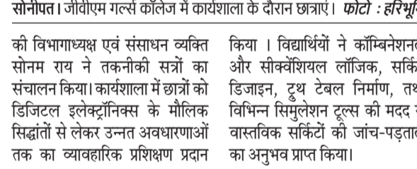
सोनीपत। जीवीएम गर्ल्स कॉलेज में कार्यशाला के दौरान छात्राएं।