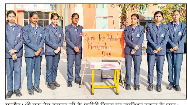
गन्नीौर। श्री गुरु तेग बहादुर जी के शहीदी दिवस पर उपस्थित स्कूल के छात्र।