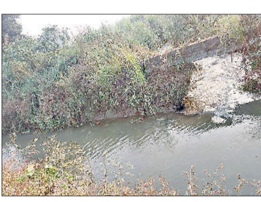
गोहाना। डिस्ट्रीब्यूट्री की पटरी टूटने से खेतों में बहता पानी

सिंचाई विभाग द्वारा पानी छोड़ते ही रोहतक डिस्ट्रीब्यूट्री टूट गई। इससे रोहतक-पानीपत हाईवे के साथ लगभग 35 एकड़ में फसलें जलमग्न हो गईं। किसानों ने फसल में नुकसान की संभावना जताई। मशीन मंगवाकर मिट्टी डालकर डिस्ट्रीब्यूट्री की मरम्मत कराई गई। सिंचाई विभाग द्वारा सोमवार की रात को रोहतक डिस्ट्रीब्यूट्री में पानी छोड़ दिया। इससे जलधरो के तालाबों को भरा जाना था। मंगलवार सुबह गांव माहरा, गुद्धा व शहर के किसान खेतों में गए तो रोहतक-पानीपत हाईवे स्थित पंखा फैक्ट्री के निकट डिस्ट्रीब्यूट्री की पटरी टूटी मिली। यहां से खेतों में पानी बह रहा था। किसान